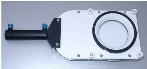
Schieber druckluftbetätigt Art. Nr. 35.300.08