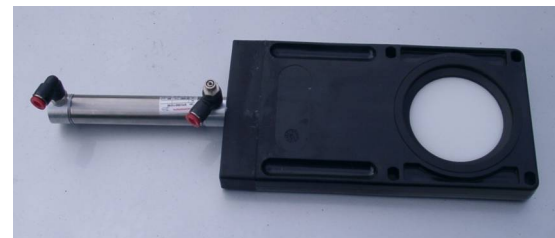
Beckenverschlußschieber mit eingebautem und einstellbarem Druckluftregler Art. Nr. 35.300.10