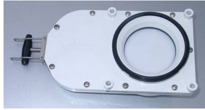
Ablaßschieber mit festem Handgriff Art. Nr. 35.300.07