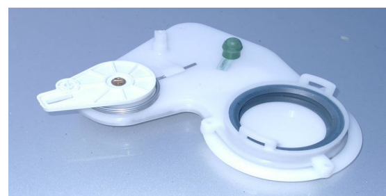
Mechanismus/ Schieber für Bravura Art. Nr. 35.304.04

Für weitere Ersatzteile rufen Sie bitte die Ersatzteilzeichnungen im Internet auf oder rufen Sie an - lassen Sie sich beraten. Ein umfangreiches Ersatzteillager gewährleistet hohe Lieferbereitschaft.