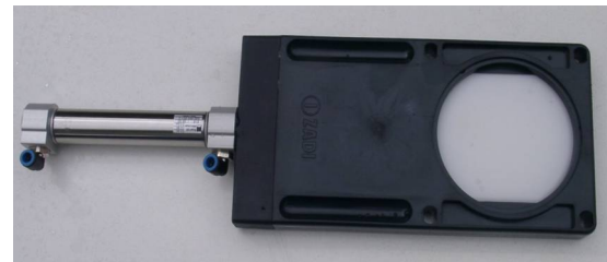
Schieber druckluftbetätigt Art. Nr. 35.300.09