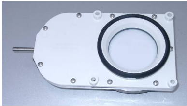
Ablaßschieber mit Nute auf Schaft Art. Nr. 35.300.06