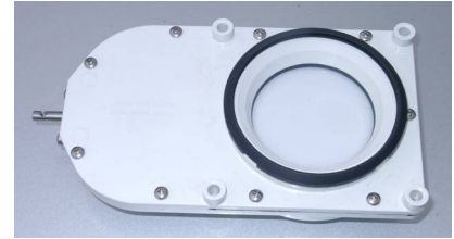
Ablaßschieber mit Bohrung auf Schaft Art. Nr. 35.300.03